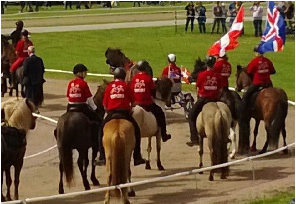
Åbningsceremoni ved VM2015 Herning