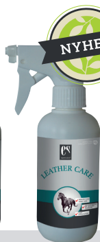
LEATHER CARE Rengør og plejer dit læder