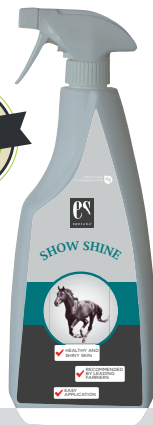
SHOW SHINE Ekstra glans til din hest

Equsana lancerer nu egen plejeserie med 6 bestseller produkter til hestens hverdagspleje. Nu kan du få din helt egen Equsana kvalitetsplejeserie til striglekassen, til rigtig gode priser. Vi har udvalgt produkter, der er afprøvede igennem flere år og som er meget nemme og drøje i brug.