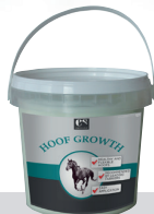
HOOF GROWTH Fremmer hovenes vækst og sundhed