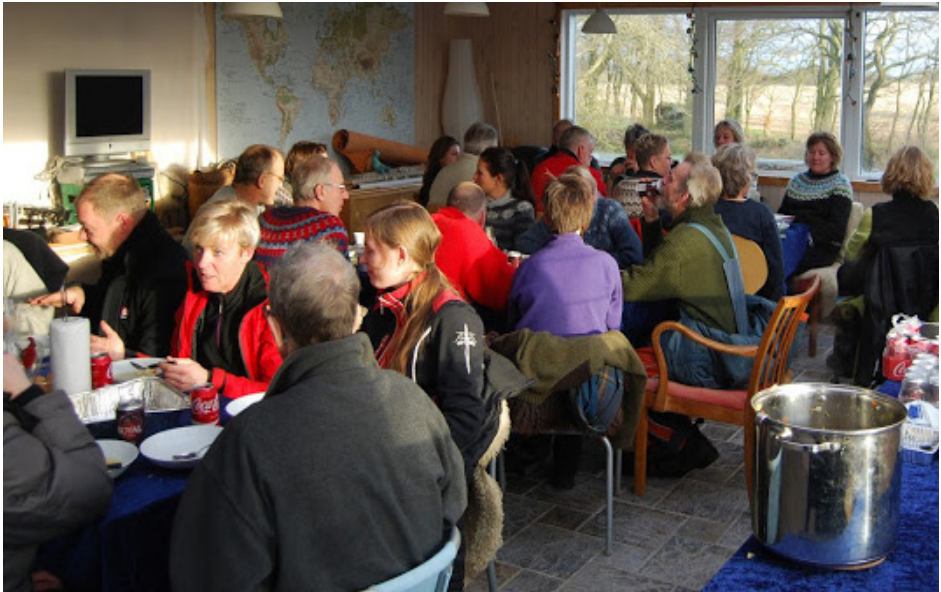
Afslutning på juletur 2015.

Annonce, helside i 4-farve tryk: 500,00 kr.