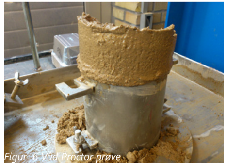
Figur 6 Våd Proctor prøve

vandindholdet med 1%, indtil grænsen for det optimale vandindhold i prøvematerialet er overskredet. Dette medfører ofte, at materialet når flydegrænsen og får en plastisk konsistens, inden forsøget afsluttes. For at få en repræsentativ prøve, udtages prøven 1/3 nede i formen, hvor den forsigtigt udtages uden at presse vandet ud af materialet og derefter lægges i en bakke, som vejes af inden tørring. Prøven sættes herefter i ovn ved 105 grader og tørres i 24 timer, hvorefter