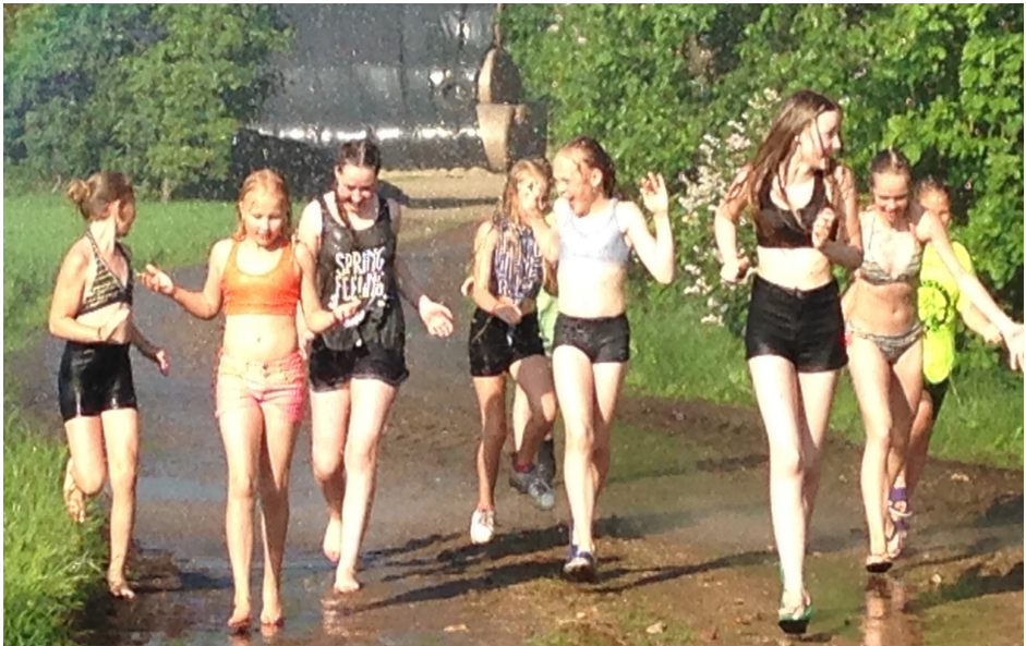
Pigerne fra Junior ridelejr i juni 2016