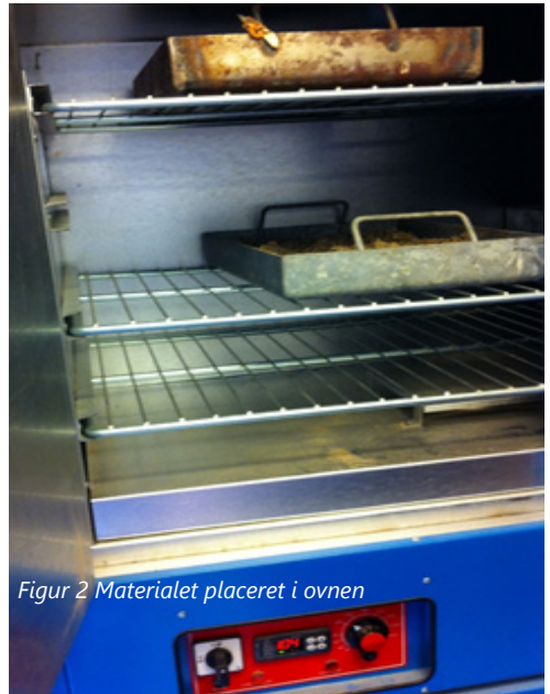
Figur 2 Materialet placeret i ovnen

Den udtagende vådprøve, vejes af og sættes derefter i en 105 grader var ovn i