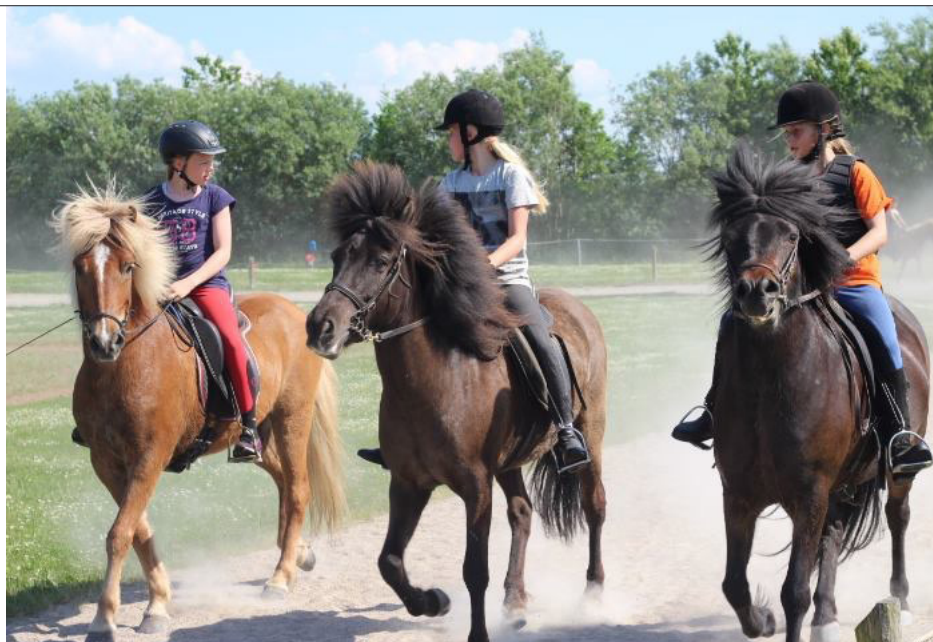
Seje Juniorrytter fra Juniorridelejren 2016