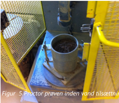
Figur 5 Proctor prøven inden vand tilsætning

Ved beregning af det optimale vandindhold, kan der optegnes et plot af vandindholdet vs. tørdensiteten, som er vist på nedenstående figur. Dette illustrerer