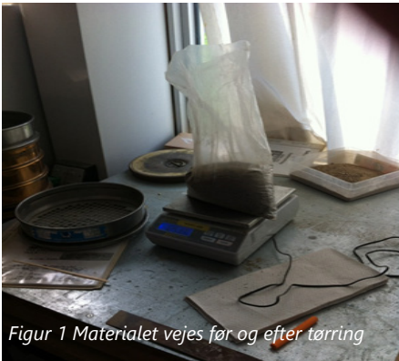
Figur 1 Materialet vejes før og efter tørring

Nedenstående er en beskrivelse af de enkelte laboratorieforsøg der blev foretaget i 2012, for definering af det eksisterende stenmel.