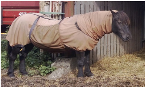
Snorre med dækken.

Næsten alle ved vist, at det var Kronprinsens ord i en tale til Prins Henrik, men jeg kom til at tænke på sætningen, en dag jeg endnu