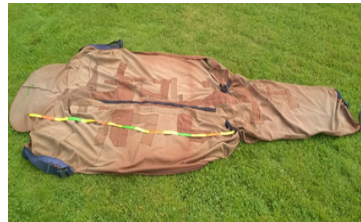
Dækkenet er over 2 meter langt

Den er meget vigtig, for under alle de påsyede lapper, er stoffet syet sammen ved anvendelse af denne "søm", der holder kanterne mod hinanden, så man kan bibeholde