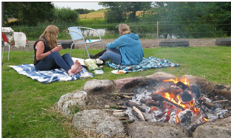
Kællingetur anno 2020