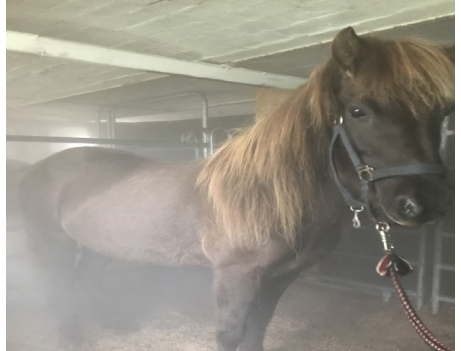
Nött i Havgus okt 2020

Der har været omkring 10 heste, der har prøvet at få inhalation. Nogen er kommet med diagnoser, andre med vejrtrækning-problemer. Har hestene været akut syge med feber eller næseflåd er de blevet tilset af dyrlæge eller afvist.