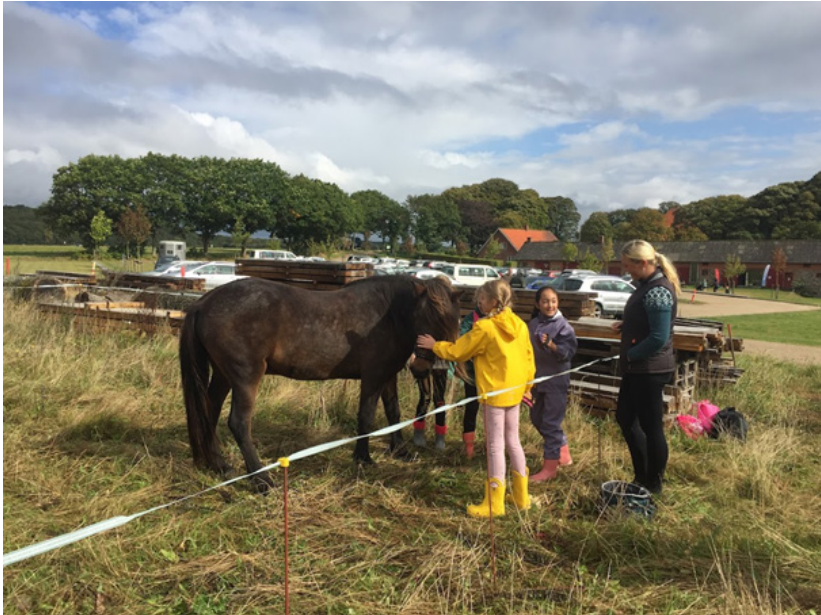
Naturens dag på Hald.