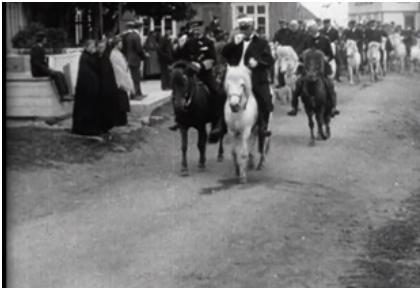
Frederik den 8. ved besøg i Akureyi i 1907. Islandsfærden.

Danske konger har flere gange besøgt Island og der er i den forbindelse blevet taget både film og fotografier af dem. Kong Frederik den 8. også kaldet Freddy besøgte i sommeren 1907 Island. Det er der berettet om i en fantastisk gammel bog "Islandsfærden", hvor bl.a. turen til Thingvellir er beskrevet. Alt skulle fragtes til Thingvellir pr. hest. På Internettet kan man finde en film-optagelse fra kongens besøg i Akureyi i forbindelse med samme rejse.