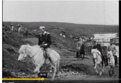
Christian den X. rider hjem fra Thingvellir. Kongerejsen til Færøerne. Island og Grønland 1921

Det er imponerende at se, hvor mange heste, der er ved begge kongebesøg. På filmen fra Chr. den X.'s besøg er der dog optagelse, der viser at bilerne har gjort deres indtog.