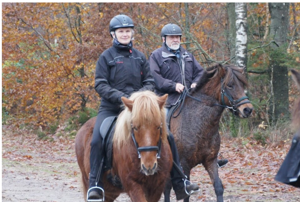
Hubertus 2023

Bladudvalg: Kjeld Flammild Gertie Kryschanoffsky